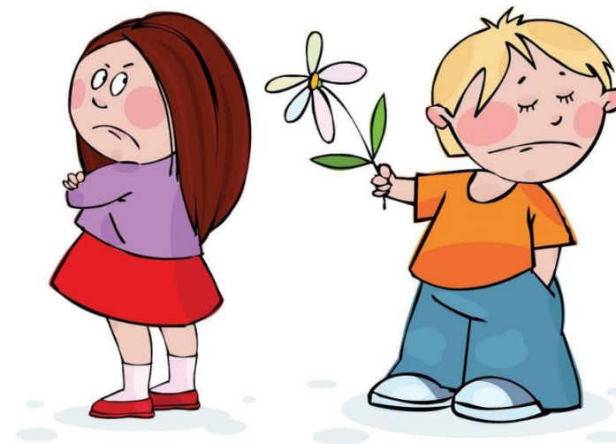
Дети могут обратиться в школьную службу

8. Сохраняя конфиденциальность Процесс медиации обеспечивает безопасность и конфиденциальность, что позволяет учащимся открыто обсуждать свои проблемы без страха осуждения.